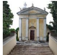
S. Lorenzo Pianezze